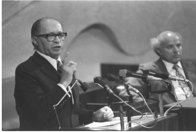
מנחם בגין נואם בכנסת ישראל, 1974